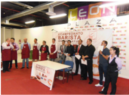
Participantes y jueces del campeonato de León