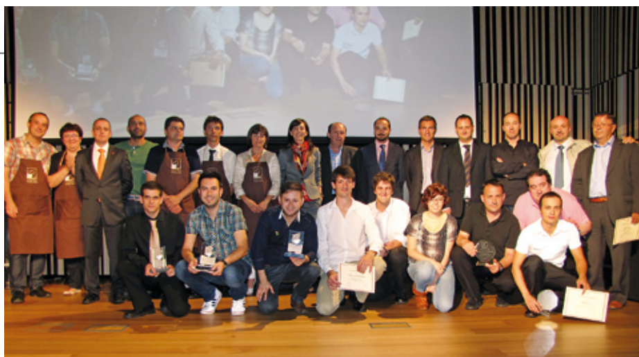
Participantes del campeonato celebrado en San Sebastián.

Patrocinadores Azúcares Antoñín, Brita, Central Lechera Asturiana, Crem International, Eunasa y Lotus Bakeries.